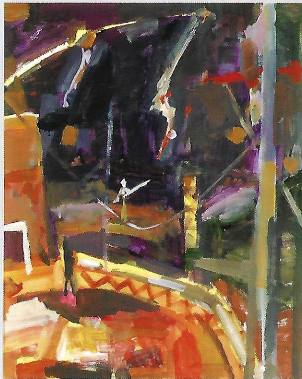
Detlev Schwarz, ZIRKUS, 2000, Öl auf Hartfaser, 87 x 70 cm 2001 vom Freundeskreis der Kunstsammlung Neubrandenburg e. V. auf dem Herbstsalon mit Mitteln der Stadt Neubrandenburg erworben und der Kunstsammlung Neubrandenburg übereignet.